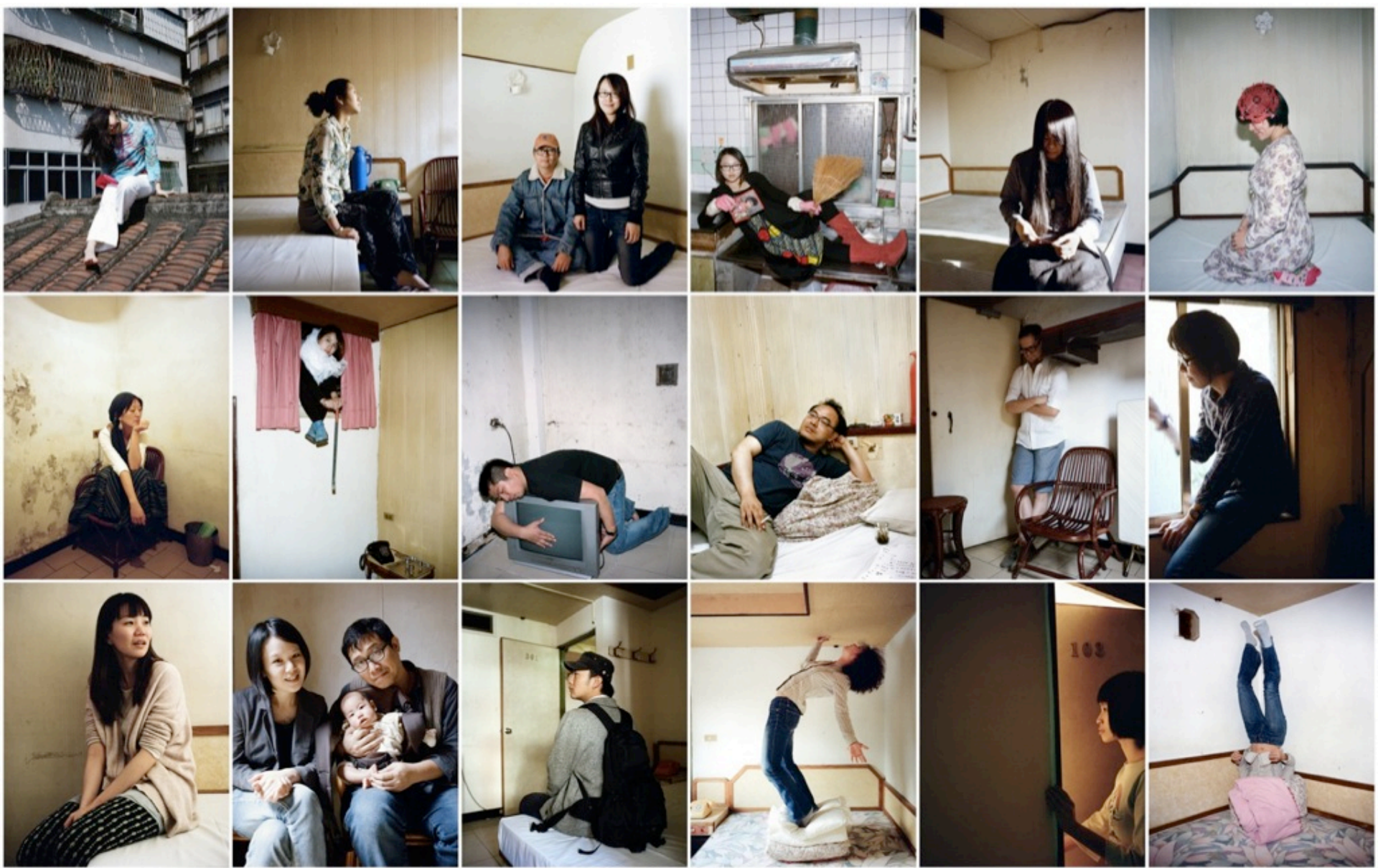
18位創作者共同打造「自己的房間」