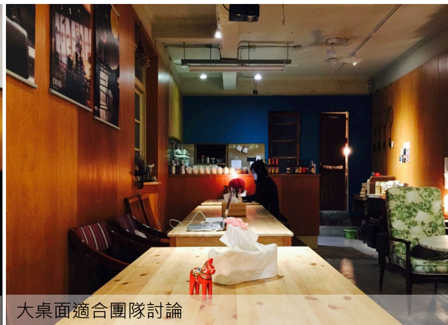
大桌面適合團隊討論